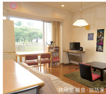
共用室 補食・談話室