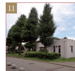
課外活動共用施設