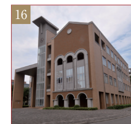
国際共同研究センター