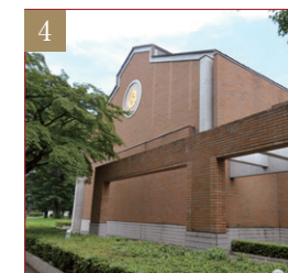
如水スポーツプラザ