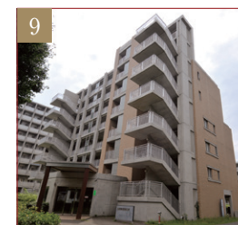
一橋寮D棟(夫婦・家族棟)