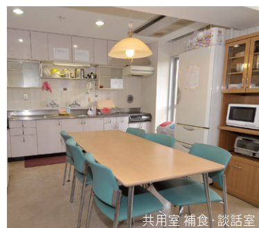
共用室 補食・談話室