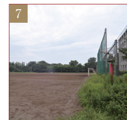
アメフト場・野球場・サッカー場