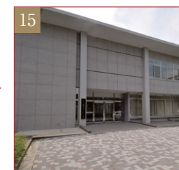
小平研究保存図書館