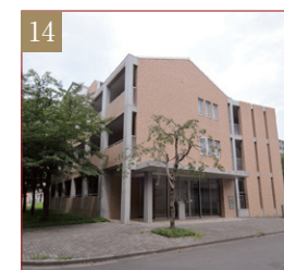
小平国際ゲストハウス