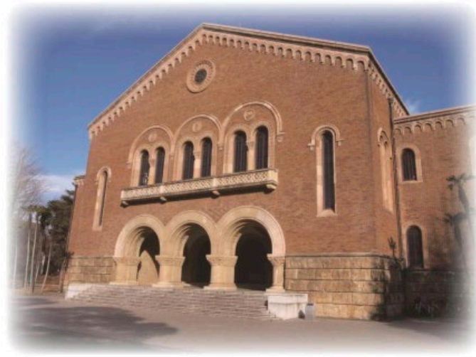
情報環境利用案内

「情報環境利用案内（第11版）」 ( https://cio.hit-u.ac.jp/ISMH/ict_guide )は、学内でコンピュータを利用できる場所、自分で持ち込んだコンピュータを利用できる場所、その他大学の提供する情報サービスについてその利用方法をまとめたものです。社会のルール、一橋大学のルールを守った上で、大学のサービスを存分に活用して研究や勉学に役立ててください。