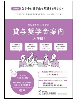
本紙では「奨学金案内」と表記