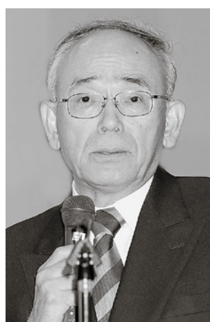
内閣官房参与 峰崎直樹氏

今、ギリシャなどがソブリンリスク（政府債務の信頼危機）にあえいでいる。日本の財政状況も悪く、国内総生産（GDP）の2倍もの赤字を抱えている。もはや無駄を省