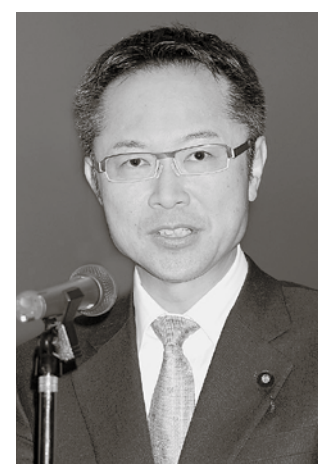
国家戦略兼 経済財政政策担当相 古川元久氏

国民皆年金・皆保険が実現して半世紀。この間、経済成長率の低下、少子高齢化の進展、雇用形態や家族形態の多様化など、当初の社会保障制度が前提としていた諸要素が