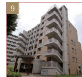
国際学生宿舎D棟(夫婦・家族棟)