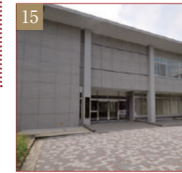
小平研究保存図書館