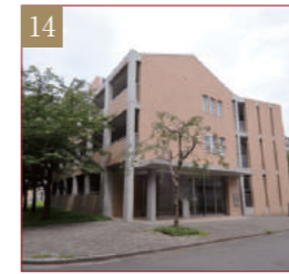
小平国際ゲストハウス