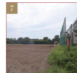
アメフト場・野球場・サッカー場