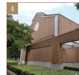
如水スポーツプラザ