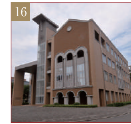
国際共同研究センター