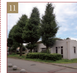
課外活動共用施設