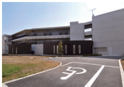
外観(北側) View from the north side