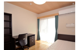
居室A Room A