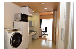
バリアフリー室 Barrier-free Room