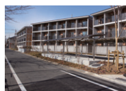
外観(南側) View from the south side