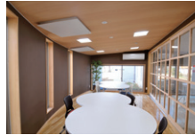
テーブルラウンジ Table lounge