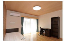
居室B Room B