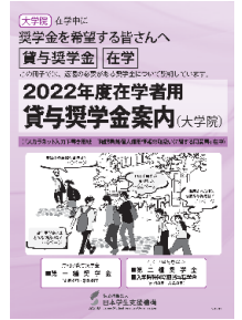
本紙では「奨学金案内」と表記