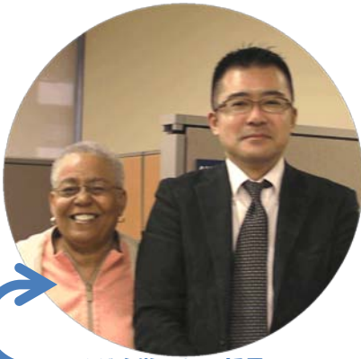
アラメダ大学のCook部長と