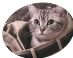
渡米中の留守を預かる愛猫

言語社会研究科、博士後期課程。 専門は言語政策、言語教育。 現在は、アメリカ合衆国オークランドで採択された「エボニクス決議（アフリカ系アメリカ人英語はアフリカに起源を持つ異なる言語であるという内容）」について研究している。 当事業では、アラメダ、ロサンゼルス、ラスベガスにて関係者へのインタビューを実施した。