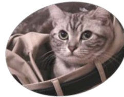
渡米中の留守 を預かる愛猫

言語社会研究科、博士後期課程。 専門は言語政策、言語教育。 現在は、アメリカ合衆国オークランドで 採択された「エボニクス決議（アフリカ 系アメリカ人英語はアフリカに起源を持 つ異なる言語であるという内容）」につ いて研究している。 当事業では、アラ メダ、ロサンゼル ス、ラスベガスに て関係者へのイン タビューを実施した。