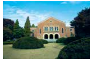
9 歴史の重みを感じさせる兼松講堂

兼松講堂のレリーフ 兼松講堂は昭和2年帝国大学(現東京大学)の建築家、建築史家の伊東忠太により設計されたロマネスク様式の建物である。建物正面にマーキュリーの校章と鳳凰、獅子、龍のレリーフとアーチを描く柱に刻まれた怪しげな怪物が迎え入れ、館内に入ると梁や柱、階段の手摺りにも化け物がにらみをきかせている。忠太オリジナルの怪物は約100体あり殆ど同じ物がなく、怪物を楽しみながら愛情をこめて設計した意図が伺われる。