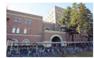
36 マーキュリータワー