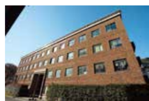
26 課外活動共用施設