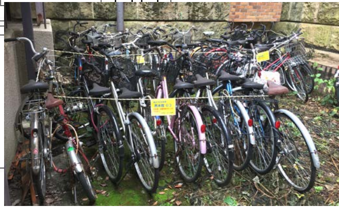
(ロープで囲った処分対象の自転車のイメージ)