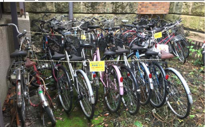
(ロープで囲った撤去対象の自転車のイメージ)